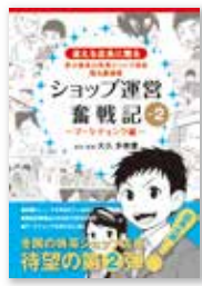
『ショップ運営 奮戦記』 NTTラーニングシステムズ様