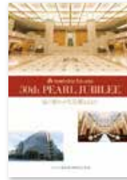
『ホテル日航福岡 30周年記念誌』